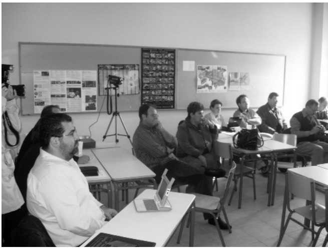
Φωτογραφία από την 22η Συνάντηση. Μεγάλη η συμμετοχή από εκπαιδευτικούς άλλων ειδικοτήτων εκτός ΠΕ19-20.

Η επόμενη 23η Συνάντηση Εκπαιδευτικών στη Δυτική Μακεδονία σε Θέματα Τ.Π.Ε. αναμένεται να λάβει χώρα στην πόλη της Κοζάνης στις 14 Μαρτίου 2010, στον χώρο που φιλοξενείται από τον Δήμο Κοζάνης η Λέσχη Φίλων Ανοιχτού Λογισμικού Κοζάνης.