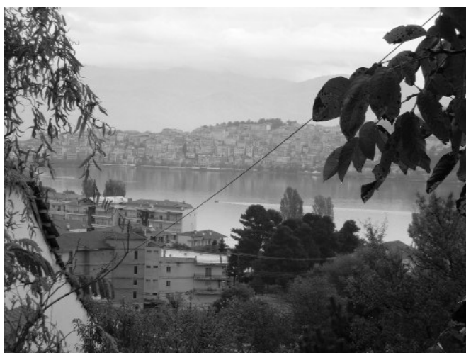
Μια πανοραμική άποψη της λίμνης της Καστοριάς, που δίνει μια ιδιαίτερη ομορφιά στην πόλη.

Η επόμενη 22η Συνάντηση Εκπαιδευτικών στη Δυτική Μακεδονία σε Θέματα Τ.Π.Ε. αναμένεται να λάβει χώρα στην πόλη της Φλώρινας στις 15 Νοεμβρίου 2009, στο καινούργιο κτίριο του 2ου Πειραματικού Δημοτικού Σχολείου Φλώρινας, με τα εξής θέματα : ΕΛ/ΛΑΚ, Μαθητικό NetBook, CSS και Ρύθμιση Ασύρματου Router.