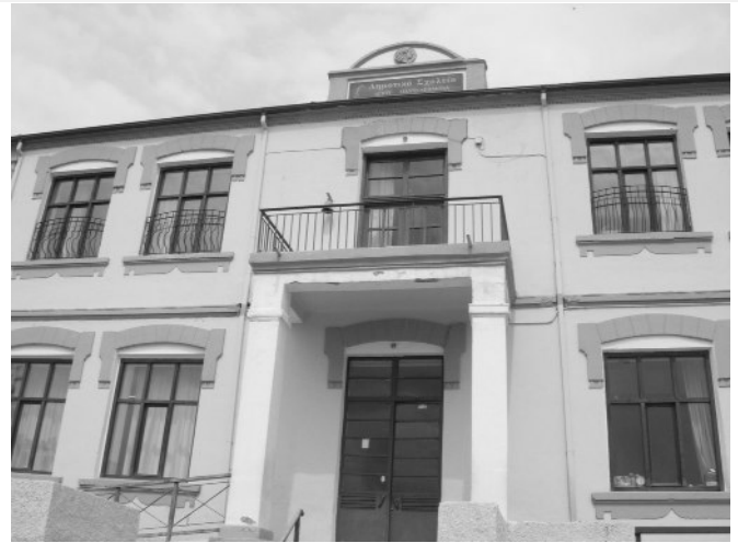
Το κτίριο του Δημοτικού Σχολείου Αγίου Παντελεήμονα του Δήμου Αμυνταίου Ν. Φλώρινας.

και το e-mail : mail@dim-ag-pantel.flo.sch.gr