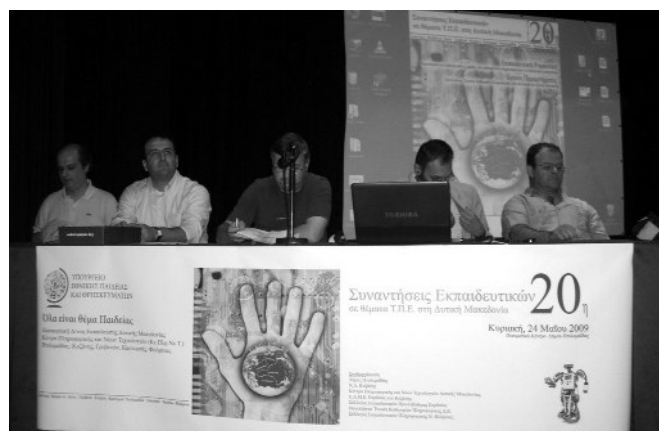
Πάνελ εκπαιδευτικών από την πρωτοβάθμια εκπαίδευση.