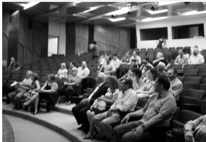
Άποψη από την εκδήλωση, που είχε μεγάλη προσέλευση κοινού και όχι μόνο εκπαιδευτικών.