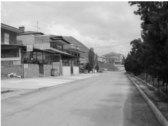
Άποψη του κεντρικού δρόμου του χωριού, δίπλα στην πλαζ της λίμνης Βεγορίτιδας ή Οστρόβου.