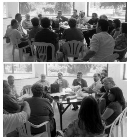
Φωτογραφίες από τη συζήτηση για την ίδρυση του Παραρτήματος της Π.Ε.ΚΑ.Π. στην Κεντρική και Δυτική Μακεδονία.