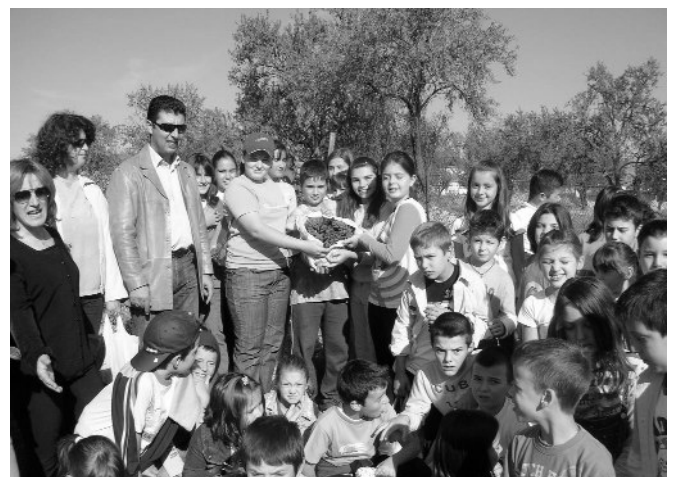
Από επίσκεψη μαθητών σε αμπελώνα του χωριού.