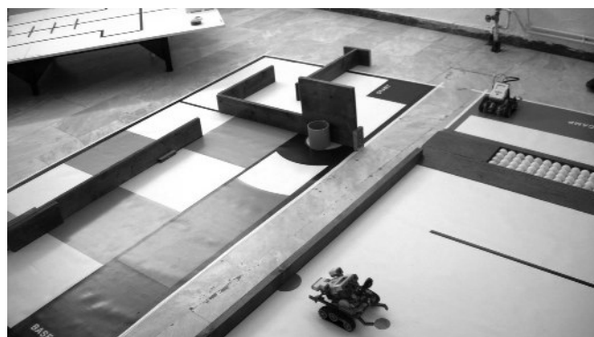
Ένα μικρό δείγμα ρομπότ από την πολύ πετυχημένη επίδειξη που έγινε στην 20η Συνάντηση.