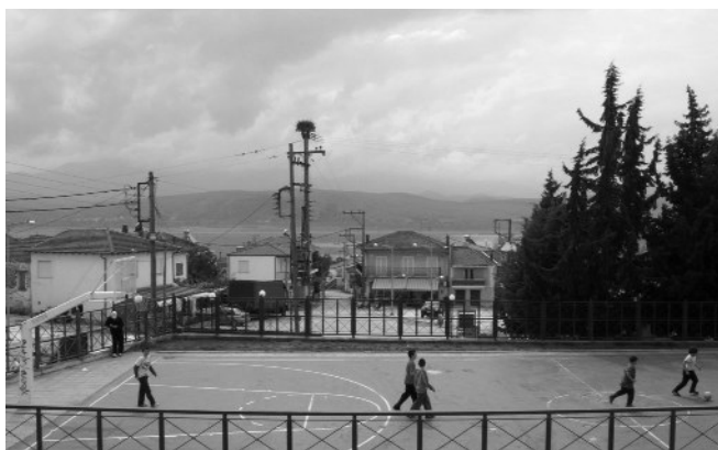
Πανοραμική άποψη του Αγίου Παντελεήμονα από την αυλή του Δημοτικού Σχολείου.